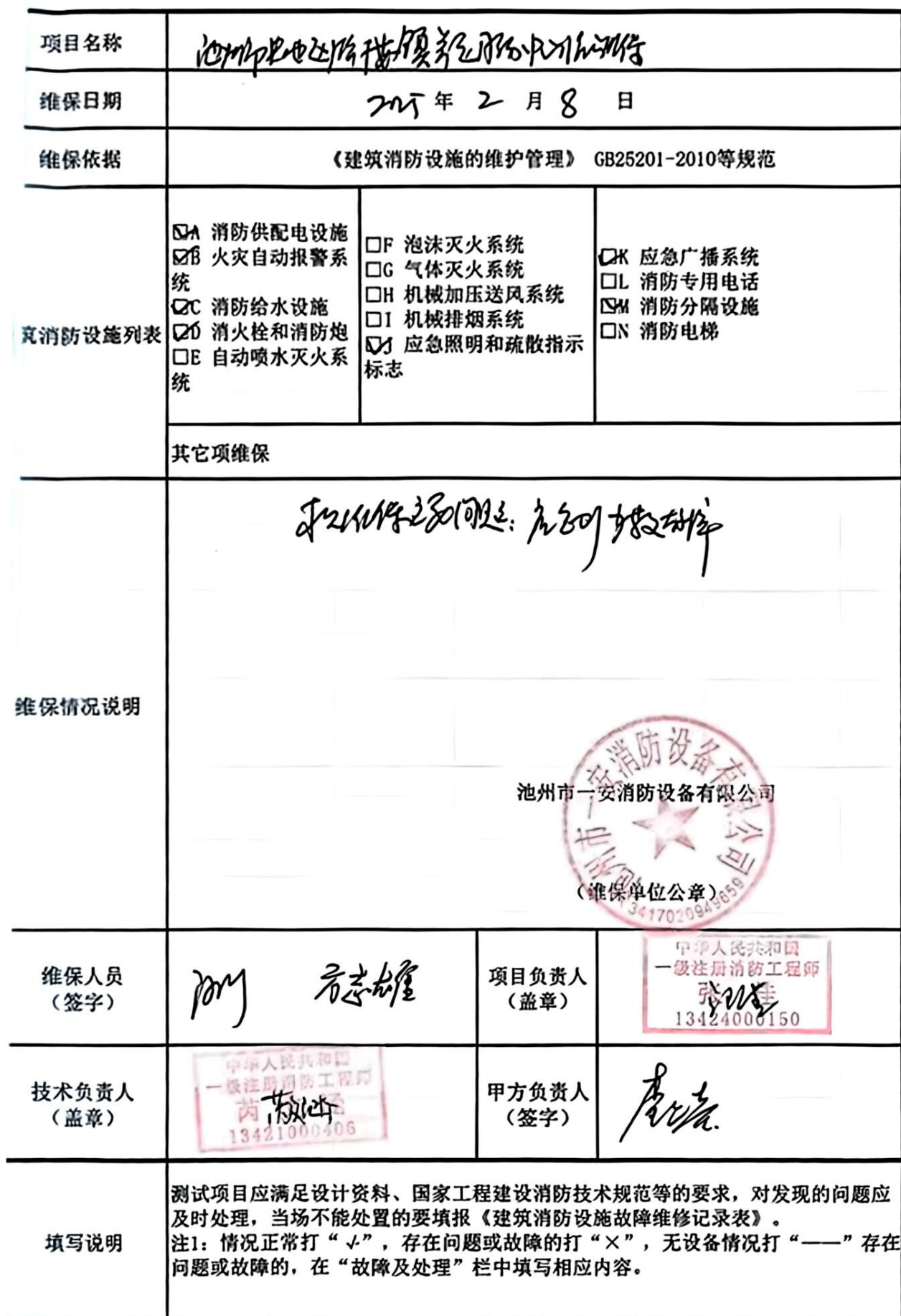
建筑消防设施维修保养记录表