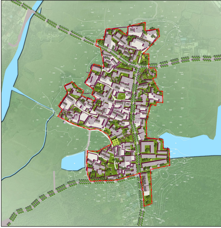
重点区域二总平面图