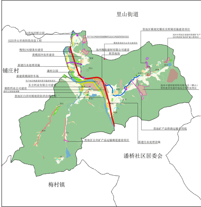
近期建设项目分布图